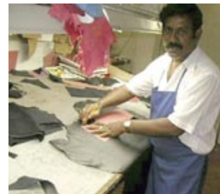
Det speciella skinnen av nöt togs fram för att motsvara styvheten i den gamla, svenska kvaliteten. Skinntjockleken skärs numera med laser vilket gör att moderna skinnjackor görs tunnare och mjukare men också fladdrigare vilket omöjliggör den gamla looken. Här fick man gå bakåt i tiden.