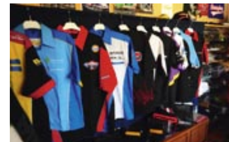
Det fanns allt möjligt. Vi hade kommit till en guldgruva.