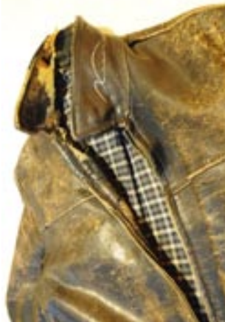
Fem år senare, efter 25 år i min ägo och efter 55 år på vägarna var det bara att inse. Jag måste lämna den nu.