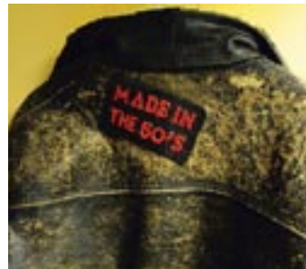
Ett stort hål i oket fixades vid sista renoveringen med en egenkomponerad badge. Budskapet gällde för både jackan och dess bärare.

LASSE ÄKTE HEM. Jackan skulle komma med flyg. Veckorna gick.