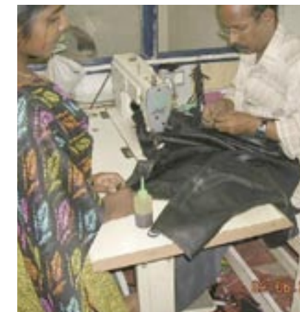
Allt kopierades in i minsta detalj. Notera skinnets grova struktur. – Jammie!